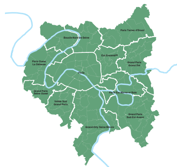
Métropole du Grand Paris